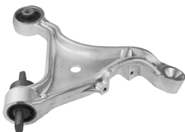
S80 Арт. MEYLE 516 050 0007/HD (Короткий № MCA0657HD) 516 050 0008/HD (Короткий № MCA0658HD)