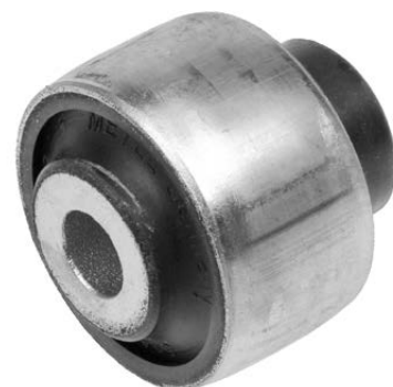
Арт. MEYLE 514 610 0005/HD (Короткий № MCB0283HD)