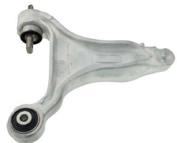
XC70 Арт. MEYLE 516 050 0024/HD (Короткий № MCA0669HD) 516 050 0025/HD (Короткий № MCA0670HD)